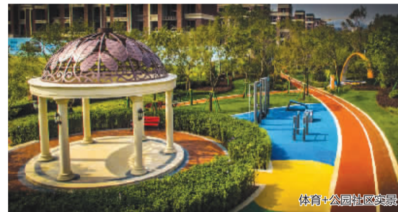
体育+公园社区实景

“冬天御寒去海南”是全国人民的共识，而鲁能正凭借着雄厚的文旅地产运作经验、成熟的分时度假体系，和大连温带海洋性气候的环境优势，建立一个“夏天避暑去大连”的新共识。