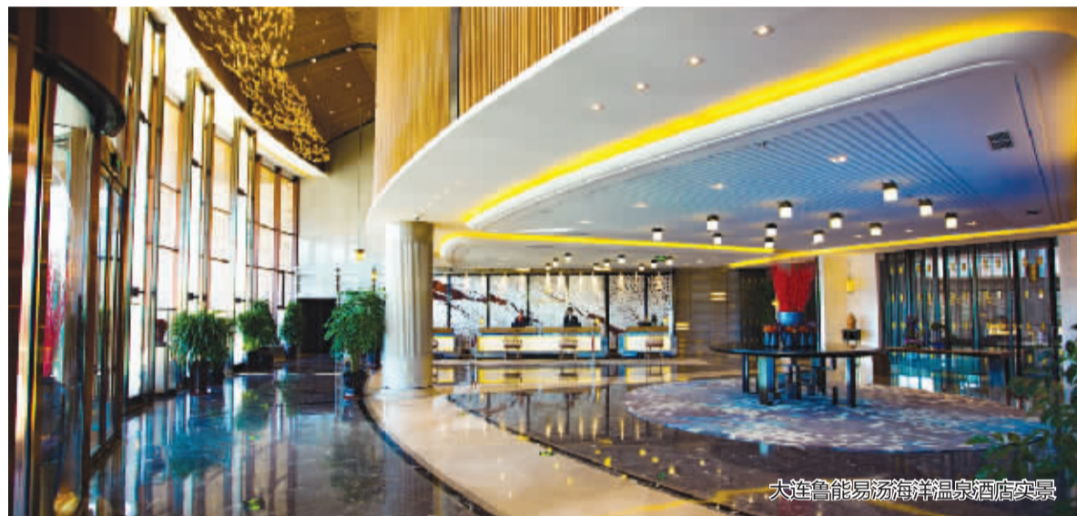
大连鲁能易汤海洋温泉酒店实景

依托两大国家战略，借势大连跨海交通工程、金州湾国际机场等城市自身发展利好，大连旅游业的发展，可以说东风。而落定后的金石滩鲁能胜地，不仅将享受近在咫尺的自贸区人口、产业红利，和京津冀人口疏解转移的广阔市场，也为大连旅游业变革带来了动一域谋全局的最佳契机。