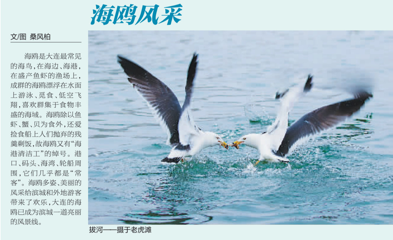
海鸱风采——摄于老虎滩