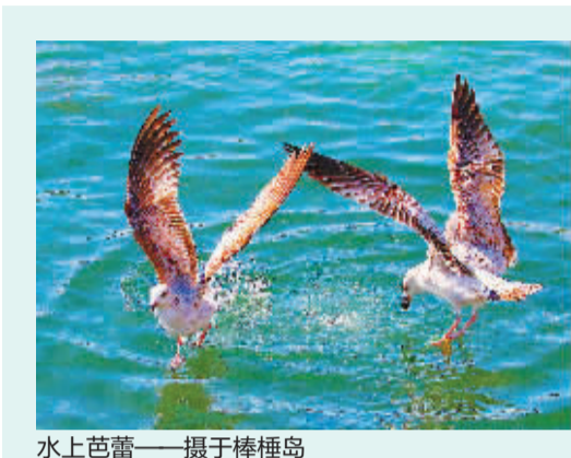
水上芭蕾——摄于棒棰岛

宋炳坤,中国硬笔书法协会理事,省硬笔书法家协会副主席、市硬笔书法家协会常务副主席。先后被授予“全国优秀中青年硬笔书法家”、“全国十杰双优书法家”、“二十年中国硬坛百家”等称号。《跟我临硬笔书法》一套三册字帖分别从笔画、偏旁等方面,由浅入深进行临摹指导和示范。所有范字均从古代优秀书法碑帖中选取,力求书写风格的统一,且尽量选取常用字,是指导硬笔书法初学者特别是中小学生学习硬笔书法的好字帖。