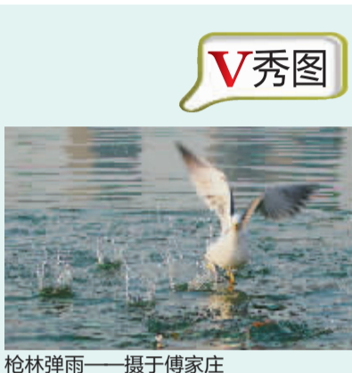
枪林弹雨——摄于傅家庄