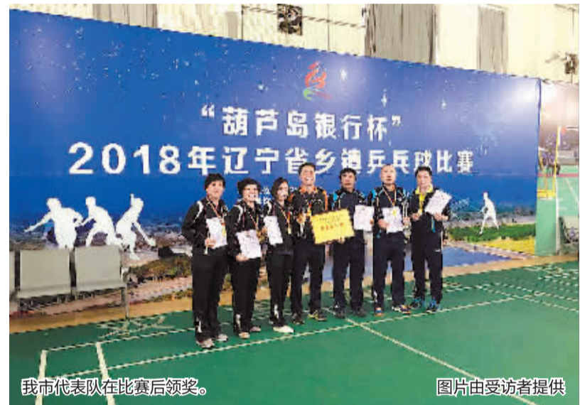
我市代表队在比赛后领奖。