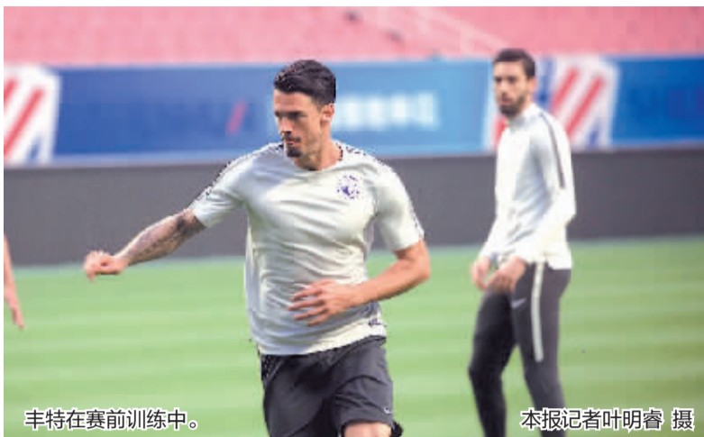
丰特在赛前训练中。

本届俄罗斯世界杯,对于已经34岁的丰特来说,很可能会是自己最后一届世界杯了。虽然加盟大连一方队后,因为球队的技战术需要,丰特并不能得到出场首发的机会,但是以他目前的状态来看,进入葡萄牙队出征俄罗斯世界杯的23人名单应该问题不大。大连一方队主帅舒斯特在评价丰特时表示,“他是一位伟大的职业球员,是葡萄牙队的绝对主力,这一点也在球场上展现出来。虽然近一段时间因为战术需要,他在一方队不能每场比赛都上场,但相信这一点不会影响到丰特代表葡萄牙队征战世界杯。”