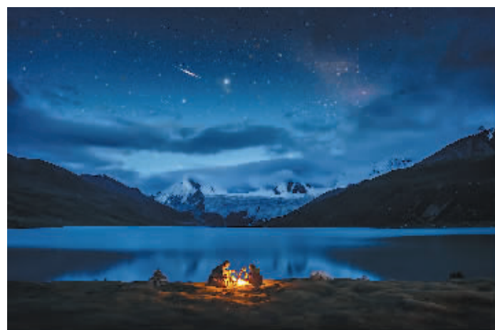
《神山的呼唤》