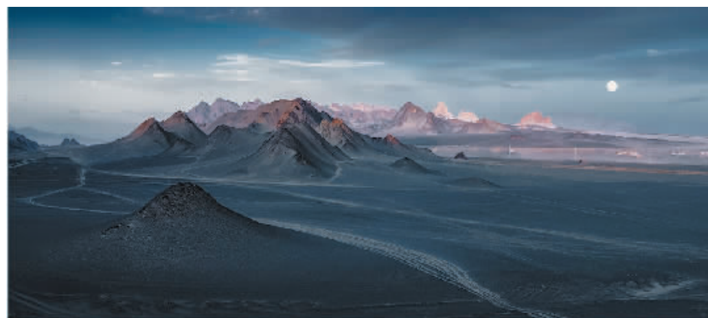
《不在地球之外》