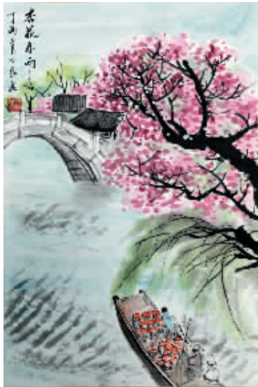
▲《杏花春雨》作者:金世良