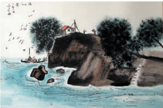
▲《渡口小景》作者:馬金三