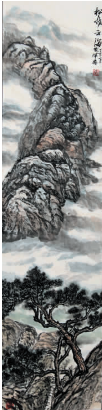
▲《松風云海》作者:王曉輝