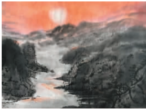
▲《晨曲》作者:溫雅小萱子