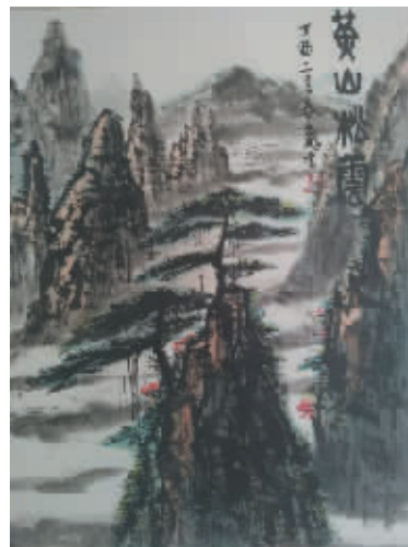
▲《黃山松雲》作者:王鵬