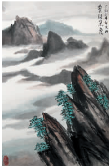
▲《黃山風光》作者:張春光