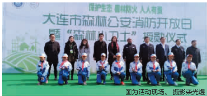
圖為活動現場。

孩子們首先來到“全國優秀公安基層單位”金普新區森林公安局參觀，首次看到了森林公安局執法辦案中心和指揮調度中心。“原來引發山火就會和其他犯罪行為一樣，警察叔叔就會來抓人的呀。”一名參加活動的小學生在看完執法辦案中