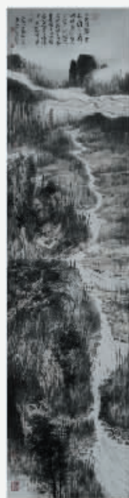
林泉高致图 34cm×136cm 2010年

文 徐恩存(当代著名美术评论家,1987年毕业于中国艺术研究院,先后就职于中国美术报,美术观察等报刊。现为中国少数民族美术促进会副会长,清华大学吴冠中艺术中心研究员。)