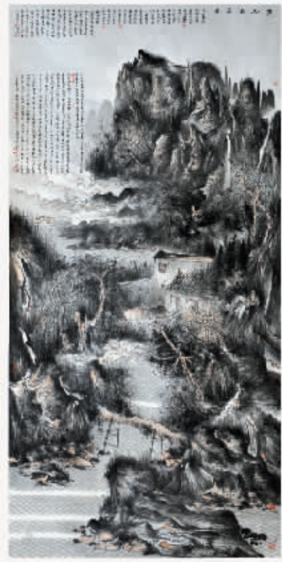
深谷幽居图 124cm×248cm 2016年

于军福,1964年出生于大连庄河,师承著名画家李宝林先生,系中国美术家协会会员、辽宁省美协理事、文化部青联美术委员会委员、中国国画家协会常务理事、中国人民大学画院特聘教授,大连渤海艺术研究院副院长,大连市美协主席团委员、大连中国画学会副会长、大连画院研究员。