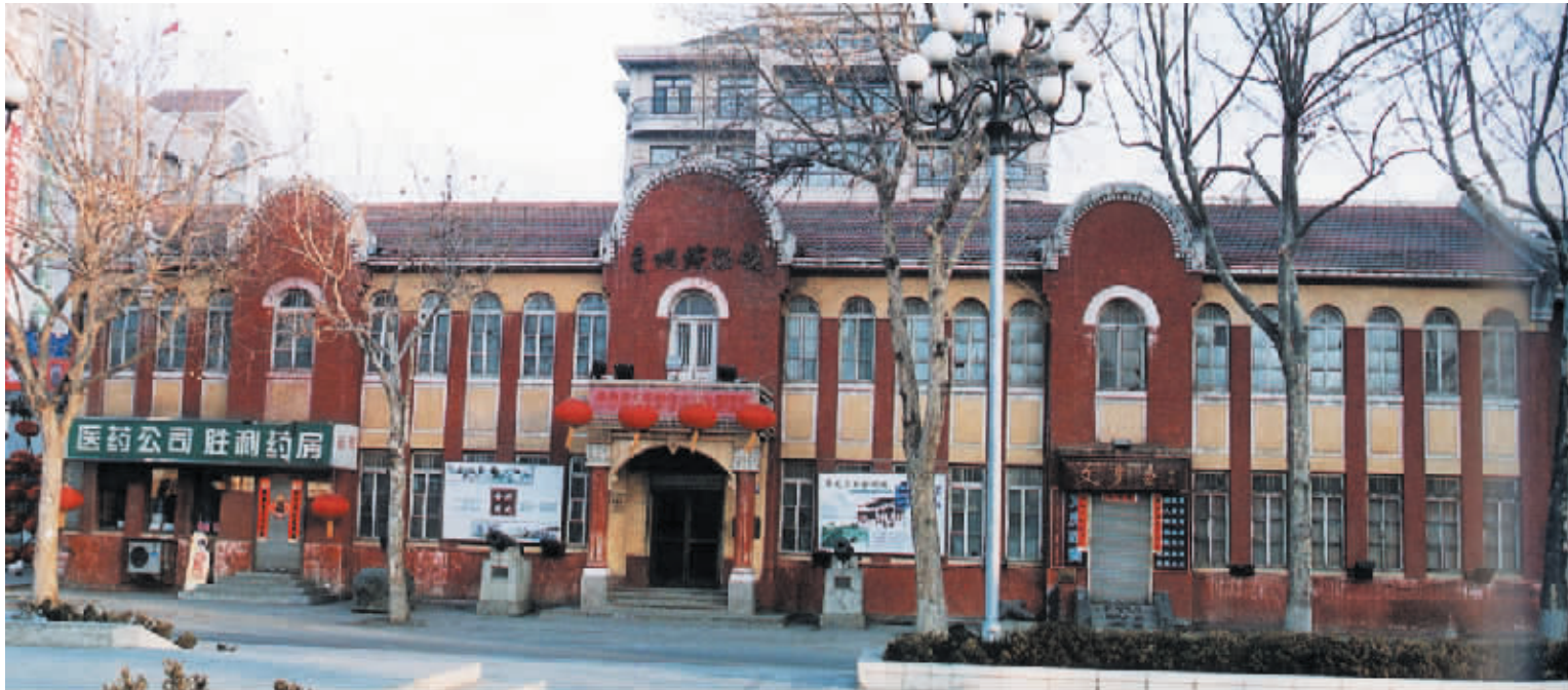
2002年时的金州会事务所旧址。

快到90岁的金州博物馆老馆建筑,见证过日本殖民者的侵略奴役,也亲历过新的联合政权的成立;曾与优秀的当地劳动者共享欢乐时光,也曾存留国宝级文物昭示遥远的乡土文明。