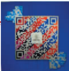
红娘来了交友俱乐部