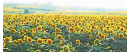
向阳花谷的葵花一望无际。