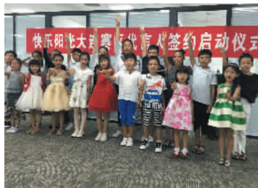
小形象代言人快乐合影。