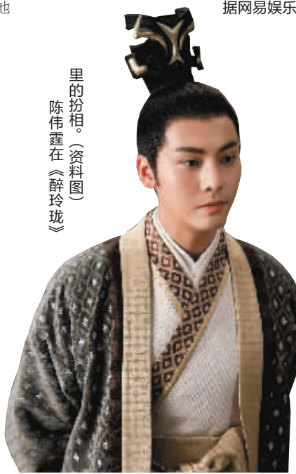
里的扮相。(资料图) 陈伟霆在《醉玲珑》