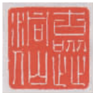
作者:孙哲慧(大连印社社员)