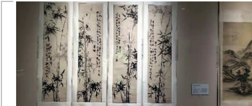
墨竹图，大连现代博物馆。

在日本统治当局管辖范围以外的大连北部地区，中国传统文化在传承和发展着。这面展柜内的书画作品都是辽南地区的书画艺术家的作品。