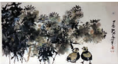
作品一，《牡丹》，尺寸：34×25cm，款识：十发，铃印：十发。