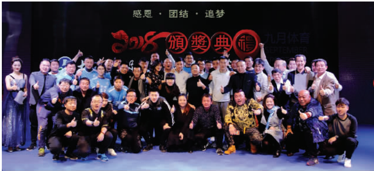
大连球迷欢聚一堂。

本报讯 1月9日下午，获奖球迷在舞台上吹响振奋人心的冲锋号。大连市足球球迷协会2018颁奖典礼在方城堡酒店热烈而又简洁地举行。协会十几个团体会员代表和各界球迷代表近300人欢聚一堂，围绕“感恩·团结·追梦”主题，回顾2018赛季不平凡经历，表达重振足球城雄风的热切愿望。典礼由市足球球迷协会、一方足球俱乐部主办，大连九月体育管理咨询有限公司承办。