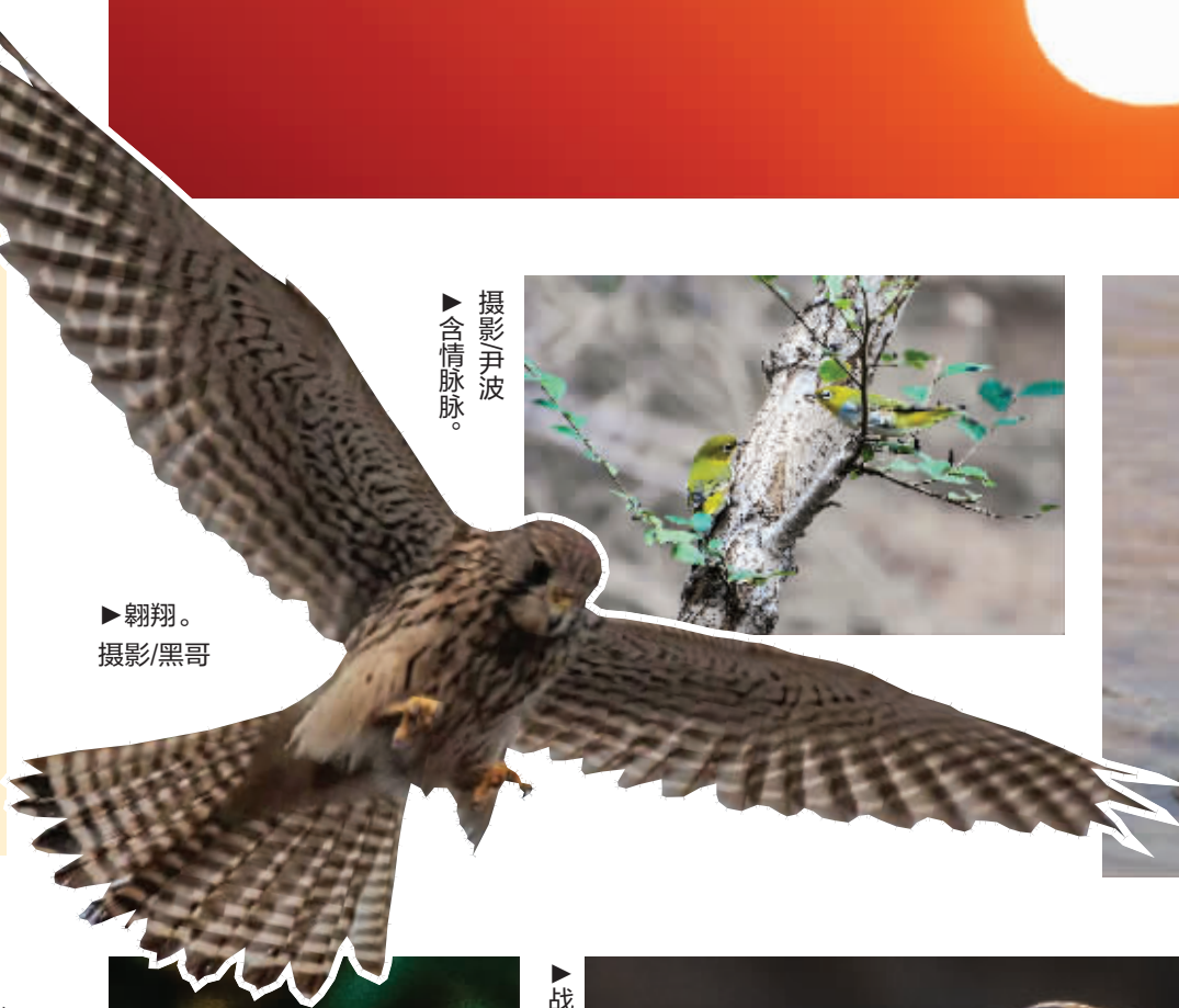
▶含情脉脉。