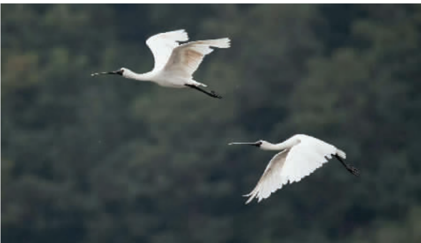
◀比翼双飞。