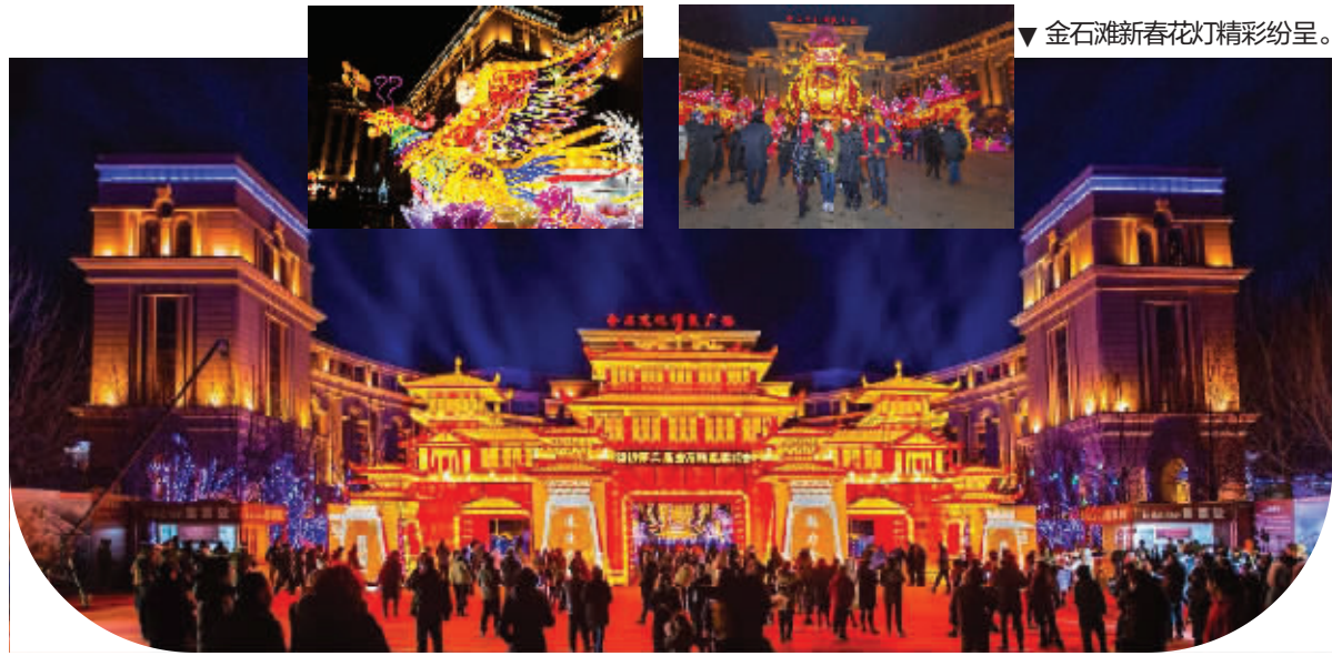
金石滩新春花灯精彩纷呈。

据了解,金石滩新春花灯会展期将持续到2月24日,每天的亮灯时间是17点到21点。 文乌兰 苏航