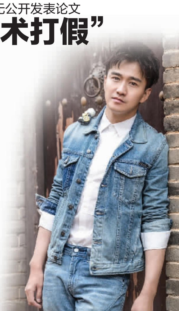
翟天临,演员,代表作《白鹿原》《大军师司马懿之军师联盟》《大当家》《心术》等。(资料图)

这几天,翟博士的热度居高不下。粉丝觉得委屈,说翟天临是个好演员,用心钻研演技,比只知道炒作的