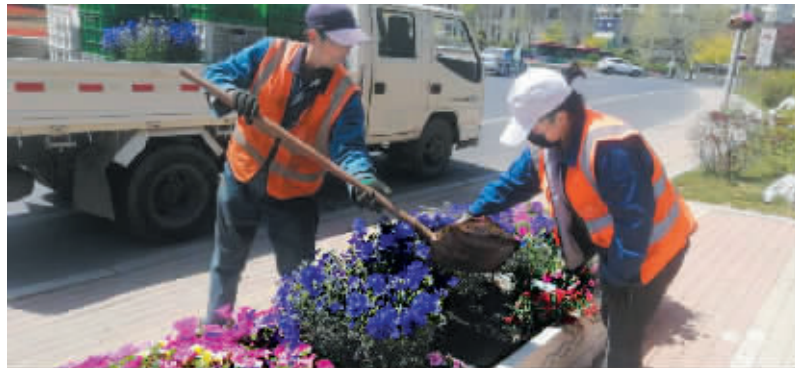
工人正在补植鲜花。

本报讯 大连市主城区主干道、立交桥在一组组鲜花的映衬下犹如跃动的旋律,然而个别市民却偷拿路边摆放的花卉,在立交桥上,连花盆花架都被整体端走。由于丢失严重,近半个月时间,大连市市政公用事业服务中心已组织补植花卉8000余株。