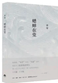
《蟋蟀在堂》 李零著 生活·读者·新知三联书店