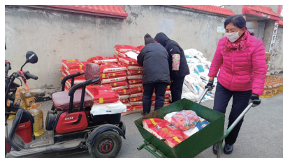
文图 通讯员刘焕恩 大连新闻传媒集团记者徐婷

本报讯 “快过年了，村里发的年货，都很实用，俺们生活越过越幸福。”1月8日，旅顺口区三涧堡街道土城子村五老单绍荣说。土城子村有800多住户，其中五老有200多人。每年春节前，该村都会为村民置办年货。在村委会门前，一袋袋米面、一箱箱豆油整齐地摆放着，村民的脸上都挂满笑容，洋溢着年味气息。