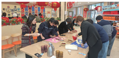
文 通讯员李昕 大连新闻传媒集团记者徐婷

本报讯 近日，旅顺口区得胜街道各社区新时代文明实践站组织居民动手制作花饽饽。在得胜街道黄金社区和大华社区新时代文明实践站，面点师傅讲解了制作方法，并展示制作过程。活动通过传承传统民俗文化，提高了大家的动手实践能力，拉近了邻里之间的感情。