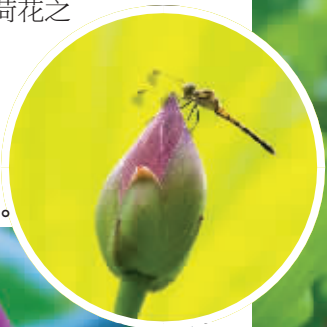
↑桑风柏 拍摄于劳动公园。