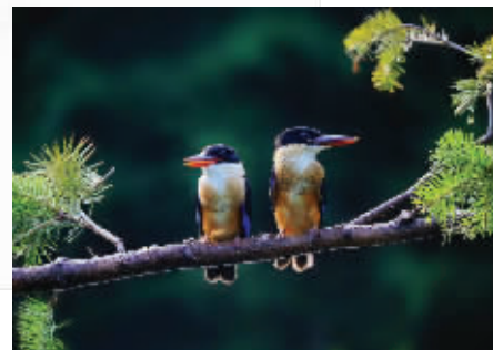
左顾右盼

在辽阳拍摄的蓝翡翠鸟,是两只刚出窝的幼鸟,在树枝上东张西望等鸟妈妈来喂食,十分可爱。