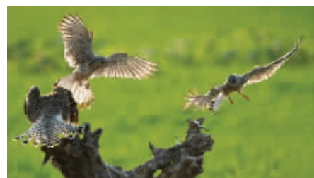
生存法则

在辽阳拍摄的蓝翡翠鸟,是两只刚出窝的幼鸟,在树枝上东张西望等鸟妈妈来喂食,十分可爱。