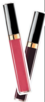
香奈儿可可小姐唇露 172色、766色

如今的香奈儿“咖啡馆”则是一个探索关于可可小姐的色彩玩乐世界,彰显的是年轻人的时髦社交态度。在这里,各种香奈儿的彩妆和香水被幻化成了“甜点”、“水果”,你可以免费试妆或美甲,也可以点一杯真正的咖啡,这里“化妆是游戏,规则只有一条:不停玩乐。”借此,香奈儿可可小姐唇露也全新亮相,17款缤纷色彩,叠加使用更有趣。据悉,当晚香奈儿中国彩妆形象大使刘诗诗使用的便是新品唇露172色。