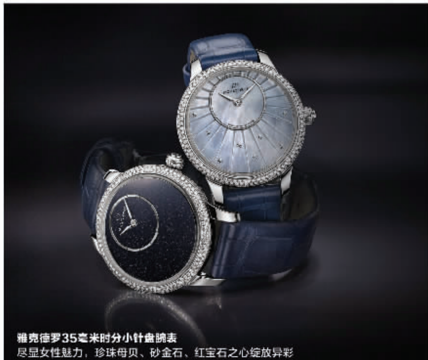
雅克德罗35毫米时分小针盘腕表 尽显女性魅力,珍珠母贝、砂金石、红宝石之心绽放异彩