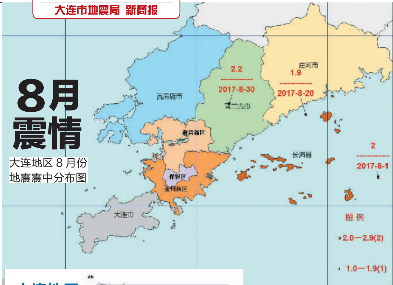
大连地区8月份地震震中分布图